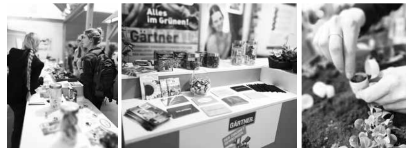
Der Messestand: Informationsmaterialien von der Nachwuchswerbekampagne, Give-Aways und spannende Mit-Mach-Aktionen