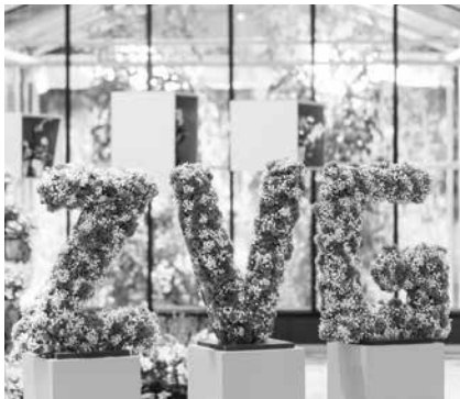
Der ZVG vertritt den Berufsstand beispielsweise auf der Internationalen Grünen Woche gegenüber Politik und Gesellschaft.

Der Zentralverband Gartenbau e.V. ist der Zusammenschluss der gartenbaulichen Berufsorganisationen, der Verbände aus den Bundesländern sowie der Bundesfachverbände und -gruppen.